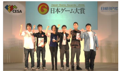
HAL 大阪「Project Trail」チーム

募集テーマを『流れる』とした今年のアマチュア部門は、応募総数が過去最多 329 作品。1次、2次、そして最終審査と厳しい審査を経て、HAL 大阪 Project Trail チームの『Trail(トレイル)』が大賞を受賞。本日の発表授賞式では、主催者を代表して、人材育成部会、部会長の松原健二よりトロフィーと副賞 50 万円が授与されました。